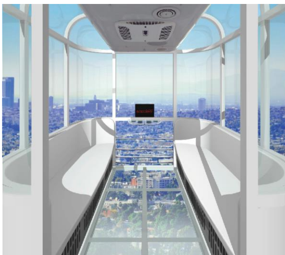
ゴンドラ(定員 6 名)イメージ